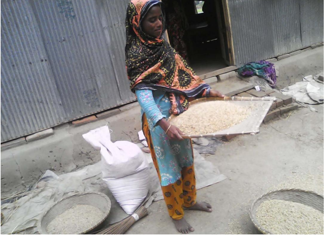
ভান্‌কি ব্যবসায় খাতে ঋণ নিয়ে সুফলভোগী সদস্যের কাজ

ফাউন্ডেশনের আওতায় সদস্য/সদস্যাদের কৃষি উৎপাদন বৃদ্ধি, আত্ম-কর্মসংস্থান ও আয় বৃদ্ধিমূলক কার্যক্রমে সর্বোচ্চ ০১ (এক) বছর মেয়াদী ঋণ প্রদান করা হয়। মোট ৪৮টি সমান কিস্তিতে ঋণের আসল ও সার্ভিস চার্জ আদায় করা হয়। ২০১৩-১৪ অর্থ বছরে ৫৩০১.৩৫ লক্ষ টাকা ঋণ বিতরণ করা হয় এবং ৪৬৬৪.০৯ লক্ষ টাকা আদায় করা হয়। জুন'১৪ পর্যন্ত ২৪০৪০.২৮ লক্ষ টাকা ঋণ বিতরণ করা হয় এবং ১৮৯৭৬.৪৫ লক্ষ টাকা আদায় করা হয়। আদায়যোগ্য ঋণ আদায়ের শতকরা হার ৯২.৩৪ ভাগ।