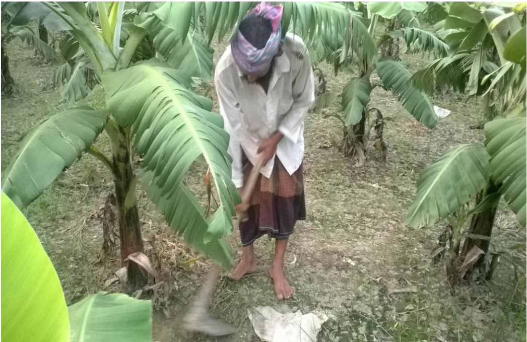
ঋণের টাকায় কলা বাগান পরিচর্যা