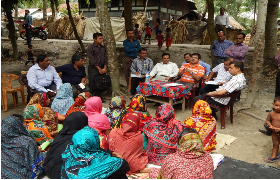
উঠান বৈঠকের মাধ্যমে সঞ্চয় ও ঋণের কিস্তি আদায়ের কার্যক্রম

ফাউন্ডেশনের উপকারভোগীদের 'নিজস্ব পুঁজি' গঠনের লক্ষ্যে ঋণ কার্যক্রমের আয় হতে সাপ্তাহিক ন্যূনতম ২০.০০ টাকা হারে 'সঞ্চয় আমানত' জমা করার ব্যবস্থা রয়েছে। ২০১৩-১৪ অর্থ বছরে ৩১৯.৩৬ লক্ষ টাকা সঞ্চয় আমানত জমা করা হয়। এ প্রক্রিয়ায় জুন'১৪ পর্যন্ত ১৮১৩.৩২ লক্ষ টাকা সঞ্চয় আমানত জমা করা হয়।